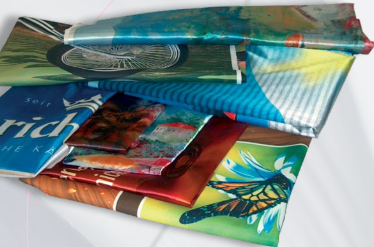
Stoff- & Teppichdruck